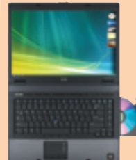
HP Compaq Business Notebook 8510w