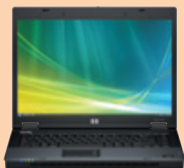
HP Compaq Business Notebook 6710b

Recursos de segurança com tela de 15" wide screen.