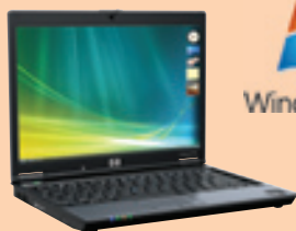
HP Compaq Business Notebook 2510p

Consulte uma Revenda HP para mais promoções.