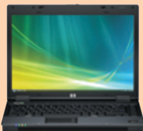
HP Compaq Business Notebook 6515b

Recursos avançados de segurança para as informações da sua empresa.