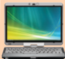
HP Compaq Business Notebook 2710p