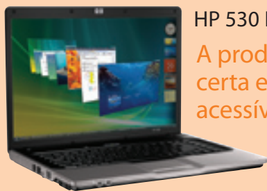
HP 530 Notebook PC

A HP recomenda o Windows Vista® Business.